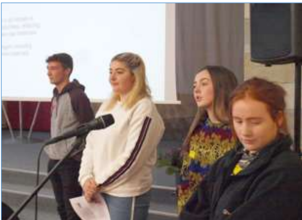
Ettekanne energiatootmisest Šotimaal

Esimesel päeval tutvusid külalised Lähte kooliga, kus toimus tervituskontsert, programmitutvustus ja väike koolituur. Väliskülalised said kuulata esitlusi nii meie kooli kui ka Eesti kohta. Lisaks toimusid ka välismaalaste esitlused energiatarbimisest oma riigis. Esitluste lõppedes jagati õpilased nelja meeskonda: video-, foto-, brošüüri- ja blogirühma. Lähte kooli õpilased suhtlesid külalistega inglise keeles ning selgitasid neile tööülesandeid.