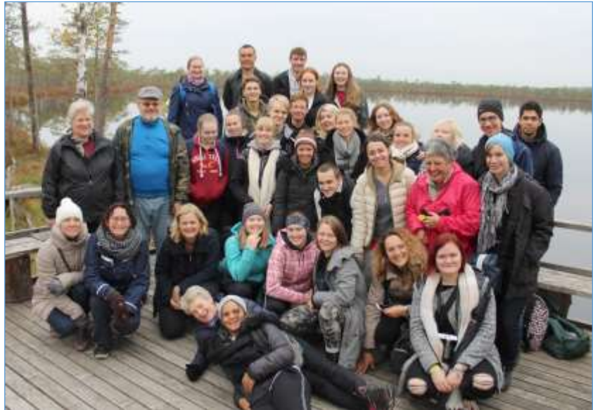
Külalised koos Lähte kooli teejuhtidega Meenikunno rabas