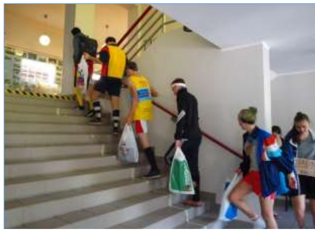
Koolis tohtis liikuda vaid abiturientide märgistatud radadel

Loomulikult ei puudunud ka sellel aastal „pommirünnakud“ ja prääksüküid. Nii kui oli kuulda sõna „pommirünnak“, pidid kõik rebased end pikali viskama, käed kuklale panema ning ootama, millal jumalad lubavad neil uuesti püsti tõusta. Söögivahetundi alustati söögipalvega ning rebased olid kohustatud