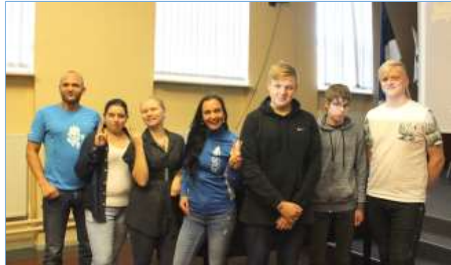
Aktiivsemad kuulajad koos SCULT vabatahtlikega

Järgmisena korraldati 4.–8. klassidele ja 9.–12. klassidele kergejõustiku neljavõistlus. 4.–8. klassil vedas ilmaga ning nad said joosta 60 meetrit ja 300 meetrit, hüpata kaugust, visata palli ja tõugata kuuli. 9.–12. klassidel aga ei vedanud ja nende spordipäeva saatis külm tuul ning tugev vihm. Seetõttu ei olnud neil võimalust kaugushüppes osaleda, kuid ülejäänud alad sai ka neil edukalt läbitud.