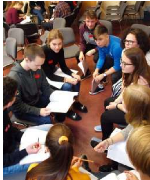
Rahvusvahelistes rühmades kavandati eesiseivaid meediategevusi

Täname õpilasi ja õpetajaid, kes programmist osa võtsid ning loode-tavasti jäid kõik üritusega rahule.