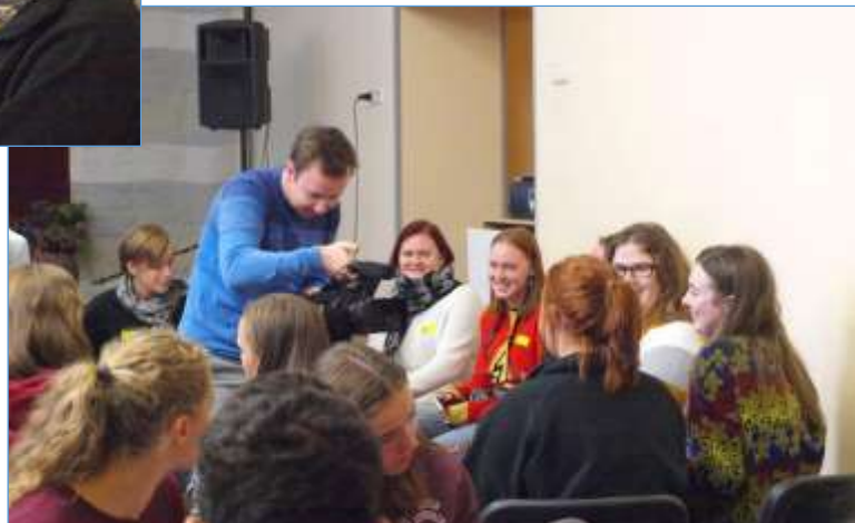
Noorte ühistegevused jäädvustati ka videopäevikuna

Kolmandal päeval sõideti bussiga Tallinna, kus toimus samuti linnatuur. Linnatuuril tutvuti nii Tallinna erinevate vaatamisväärsustega kui ka kohaliku eluoluga. Külastati vanalinna, Kadrioru parki ning lauluväljakut. Linnatuurile järgnes lõunasöök Lidos. Enne koduteele asumist külastati ka Energia avastuskeskust, kus tehti tutvust