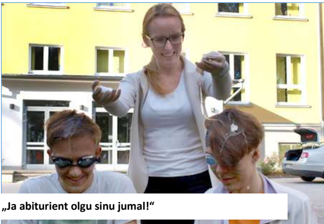
„Ja abiturient olgu sinu jumal!“

Mida sina rebaste ristimise traditsioonist arvad? Kas see on vajalik ning kas seda traditsiooni tuleks jätkata?